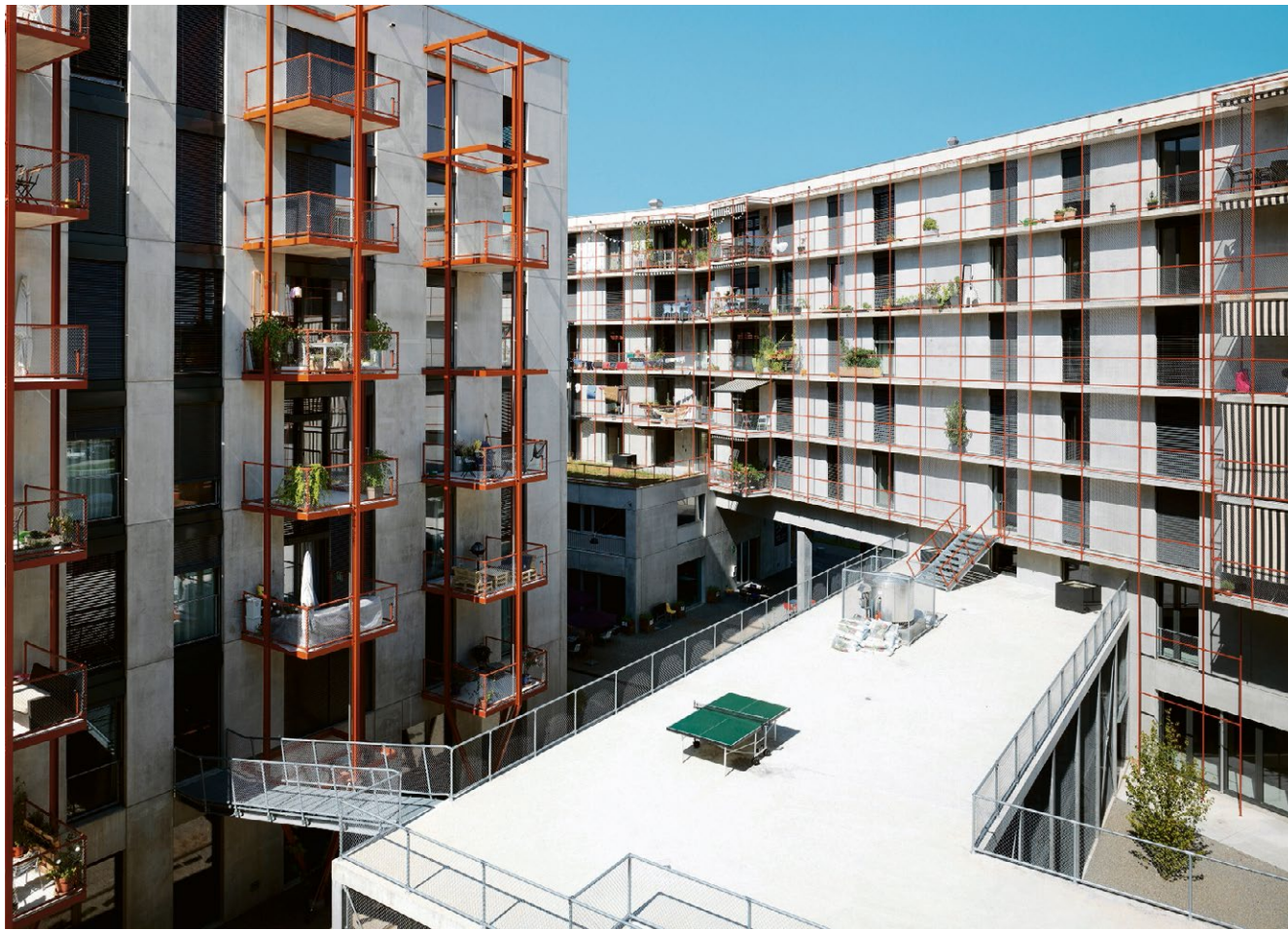
Rau, aber nicht roh: Aussenansicht der Siedlung Zwicky Süd.

Die Architekten beweisen damit Mut zur Urbanität, wo bisher keine gefragt war. Nicht, indem sie die Stadt hierhin implantieren, wie beim Richti-Areal in Wallisellen oder beim Limmattfeld in Dietikon. Sondern indem sie die Agglomeration mit ihren eigenen Mitteln schlagen: Zum robusten Städtebau gehört eine raue Architektur, die auf den Ort und seine Vergangenheit antwortet. Balkone und Laubgänge balancieren