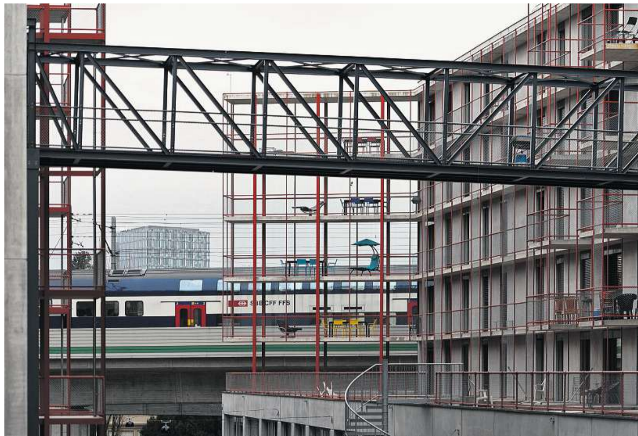
Eine Brücke als erweiterter Balkon und viel Metall, an dem sich bald Kletterpflanzen emporranken: Zwicky Süd.

Die Lage der Siedlung ist nicht jedermanns Sache. Die ehemalige Spinnerei Zwicky ist noch der attraktivste Nachbar, sonst dominieren die Autobahn, Schnellstrassen, Grossmärkte und ein Bahnviadukt das Gebiet. Allerdings gibt es mit der Glatt und dem renaturierten Chriesbach, an dem sogar Biber gesichtet wurden, auch ein wenig Grün. Dass die Siedlung für urban gesinnte Geister dennoch attraktiv sein kann, realisiert man bei der Wohnungsbesichtigung. Wo sonst kann man eine 13½-Zimmer-Wohnung von 430 Quadratmetern mit Terrasse und mehreren Duschen und Bädern mieten? Das Zielpublikum sind